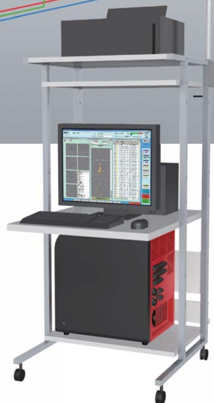
PCラックに組み込んだ例

コンパクトな筐体のLTは、お求めやすい価格帯でご提供できる検査装置となっています。また、ステージなどの枚葉検査でもご使用いただけます。