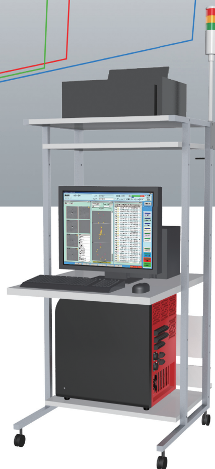
PCラックに組み込んだ例

コンパクトな筐体のLTは、お求めやすい価格帯でご提供できる検査装置となっています。また、ステージなどの枚葉検査でもご使用いただけます。